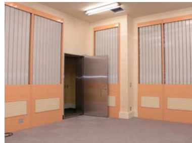
精密機器を設置できる部屋もあります！