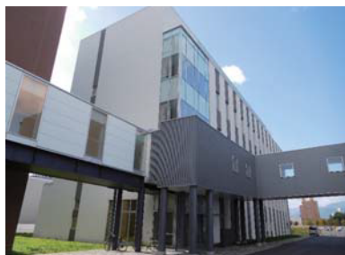
北キャンパス総合研究棟6号館