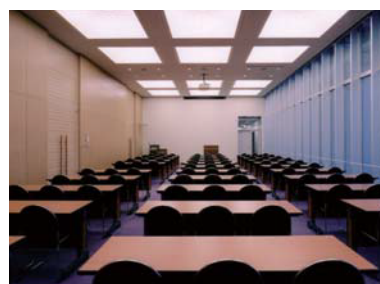
大会議室 (創成科学研究棟)