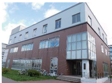
北キャンパス総合研究棟3号館

北海道大学 創成研究機構では北キャンパス総合研究棟3号館、6号館のオープンラボラトリーを活用するプロジェクトを募集しております。北大北キャンパスエリアには、様々な研究機関が集積しており、産学・地域協働推進機構などのサポート組織、食堂・売店などの福利厚生も充実しています。また、オープンファシリティの最先端装置が利用できます。